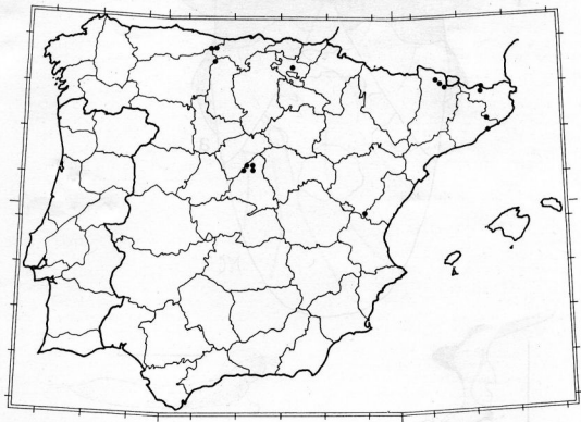
MAPA 1. Distribución de los puntos de captura de Lygaeus simulans Deckert, 1985 para la Península Ibérica. Cuadrícula UTM de 100 Km 2 .

Distribution de les points de capture de Lygaeus simulans Deckert, 1985 pour le Péninsule Ibérique. Graticule UTM de 100 Km 2 .