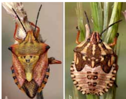
Figure 3. – Carpocoris mediterraneus atlanticus : a) adulte, b) larve stade V.

pas été restitués. Nous avons donc poursuivi nos récoltes afin de mener également des analyses moléculaires sur d'autres spécimens de Carpocoris que nous avons ensuite publiées [LUPOLI et al. , 2013].