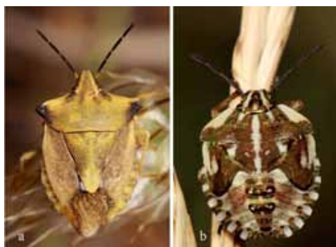
Figure 2. – Carpocoris fuscispinus : a) adulte, b) larve stade V (clichés Vincent Derreumaux).