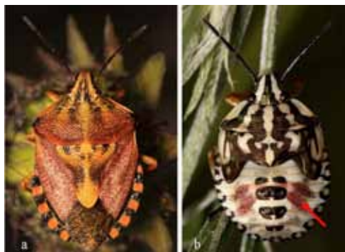
Figure 4. – Carpocoris pudicus : a) adulte, b) larve stade V.

pas été restitués. Nous avons donc poursuivi nos récoltes afin de mener également des analyses moléculaires sur d'autres spécimens de Carpocoris que nous avons ensuite publiées [LUPOLI et al. , 2013].