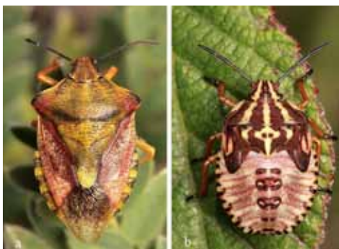
Figure 5. – Carpocoris purpureipennis : a) adulte, b) larve stade V.

Dans la monographie concernant Carpocoris fuscispinus dans la Faune de France 96, l'incertitude et la confusion se révèlent pourtant encore chez ces auteurs. En page 170, RIBES & PAGOLA-CARTE [2013] qualifient Carpocoris mediterraneus de « géotype », puis neuf lignes plus bas de « phénotype », et en page 171 ils mentionnent que certaines stations sont « trop réduites pour penser que deux taxons [ C. fuscispinus et C. mediterraneus atlanticus ] écologiquement si différents puissent cohabiter dans ces aires territoriales tellement restreintes ». Trois termes différents : géotype, phénotype et taxon, pour qualifier la même chose ! Dans l'introduction de leur ouvrage en page II, ils mentionnent aussi à ce sujet : « la solution à laquelle nous avons abouti [...] a été une mise en synonymie qui ne nous satisfait pas [...] », et plus loin : « Toutefois, il faudra poursuivre des études approfondies sur ces punaises, spécialement à l'aide de techniques moléculaires, nos recherches morphologiques