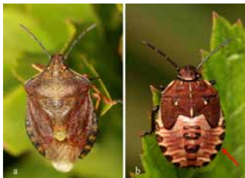
Figure 1. – Carpocoris melanocerus : a) adulte, b) larve stade V.